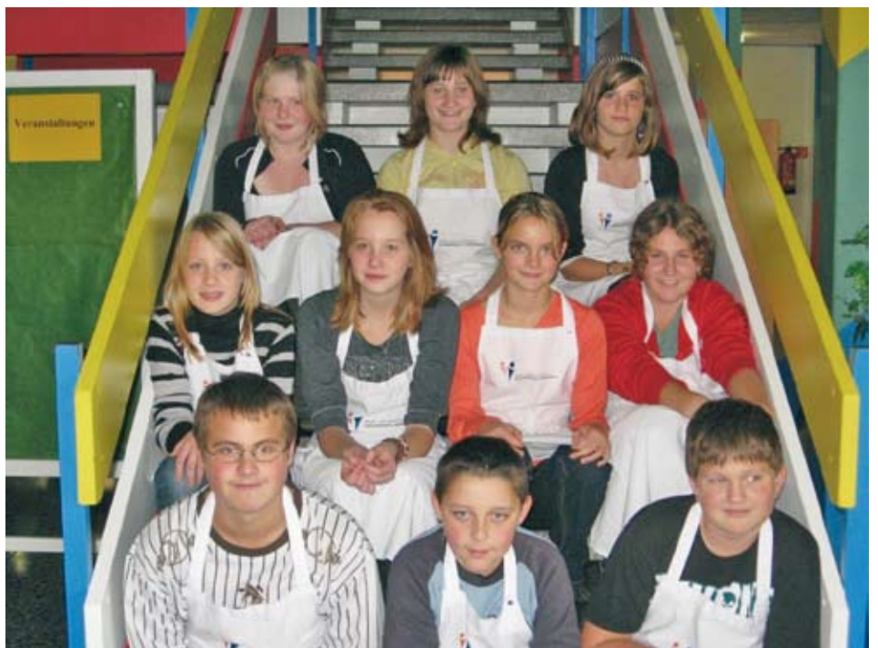
Das Catering-Team der Schule