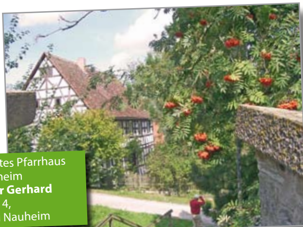
4. Platz altes Pfarrhaus Burgbernheim Schneider Gerhard Usastraße 4, 61231 Bad Nauheim