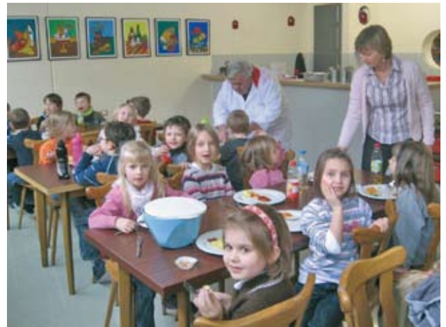
Die Kinder der Ganztagesklasse beim Mittagessen

Übrigens gibt es dieses Angebot erst seit dem Jahr 2009 und Burgbernheim ist die einzige Grundschule im Umkreis von 50 km, die als Standort für eine Ganztagsklasse in