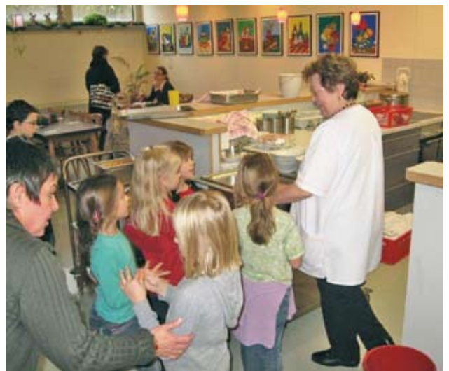
Die Kinder sind neugierig, was es zum Essen gibt