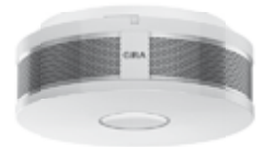
Gira Rauchwarnmelder Dual/VdS