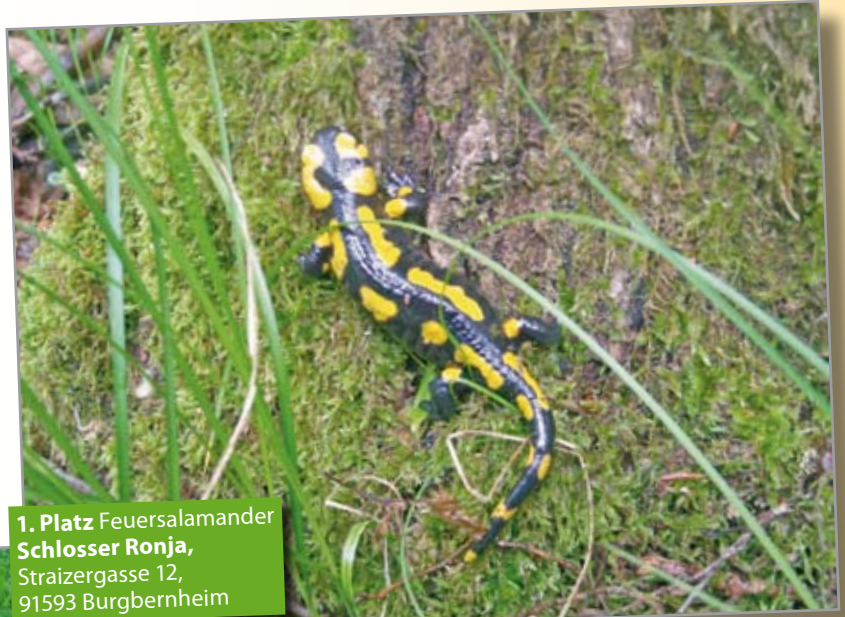
1. Platz Feuersalamander Schlosser Ronja , Straizergasse 12, 91593 Burgbernheim