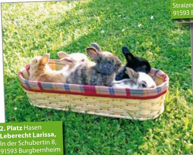
2. Platz Hasen Leberecht Larissa , In der Schubertin 8, 91593 Burgbernheim