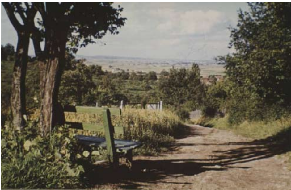
Der Hessinggraben 1955