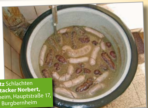
4. Platz Schlachten Scheitacker Norbert , Buchheim, Hauptstraße 17, 91593 Burgbernheim