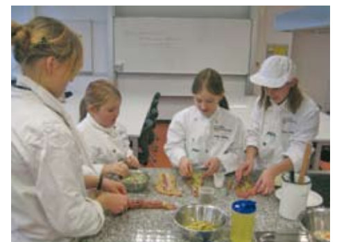
Die Rouladen werden zubereitet ...