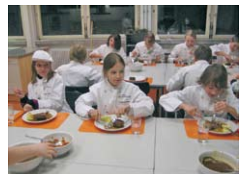
... und dann verzehrt